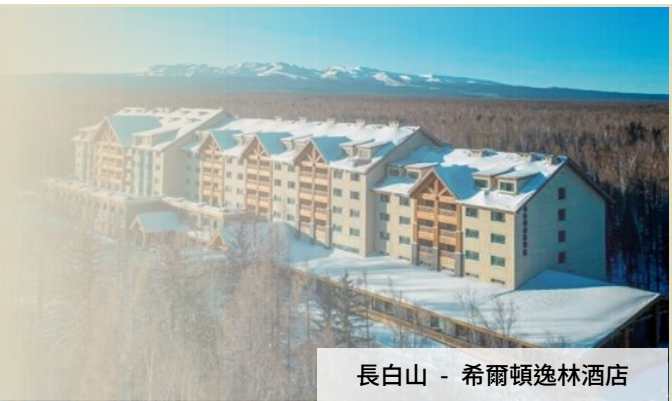
長白山 - 希爾頓逸林酒店