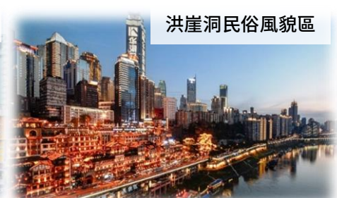
洪崖洞民俗風貌區