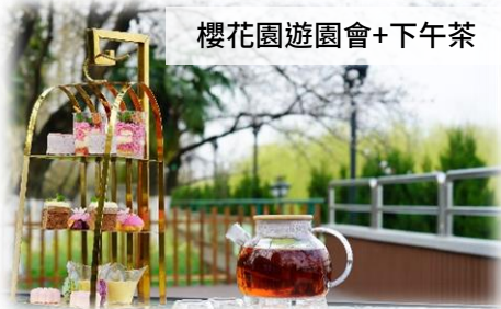
櫻花園遊園會+下午茶