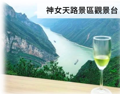
神女天路景區觀景台