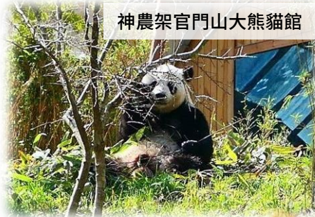
神農架官門山大熊貓館