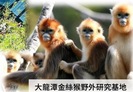
大龍潭金絲猴野外研究基地