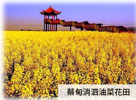
蔡甸消泗油菜花田