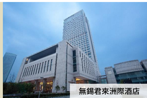
無錫君來洲際酒店