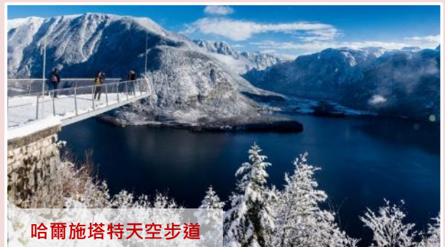
哈爾施塔特天空步道