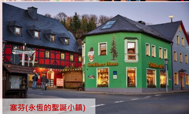
塞芬(永恆的聖誕小鎮)