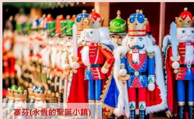
塞芬(永恆的聖誕小鎮)

塞芬 ：小鎮以其精美的木製聖誕裝飾品、木製玩具和手工藝品而聞名於世。遊客可以在這裡尋找獨特的聖誕禮物，同時還能欣賞到當地手工藝師的技藝展示，並體驗到德國聖誕的獨特氛圍。