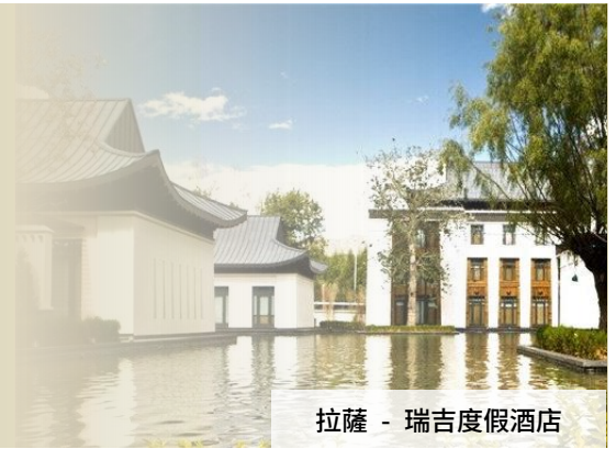
拉薩 - 瑞吉度假酒店