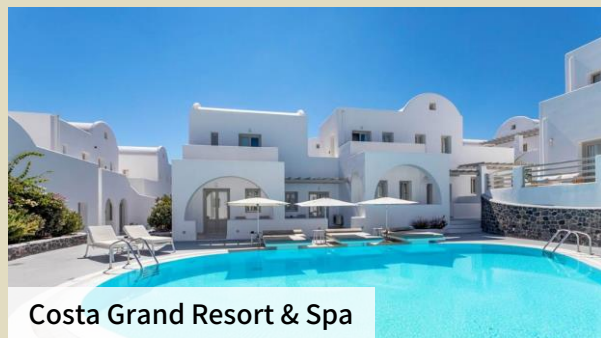
Costa Grand Resort & Spa