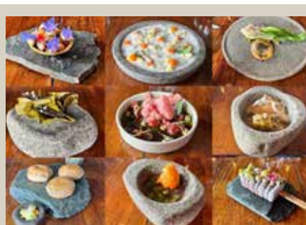
南美洲 50 佳餐廳 Gustu