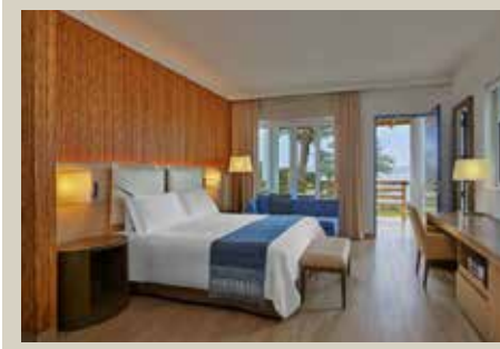
帕拉卡斯 2 晚入住 5 星級 Hotel Paracas, a Luxury Collection Resort 或同級