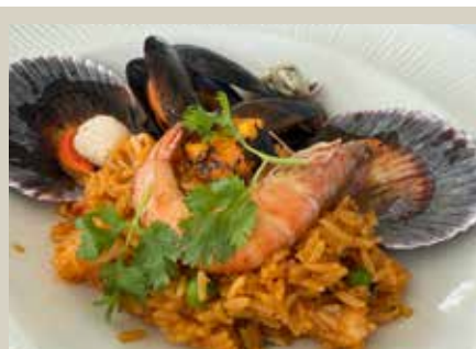
海中玫瑰La Rosa Nautica 海景餐廳