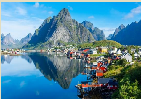
雷納『挪威最美麗村莊』

位處挪威西北部邊緣，以非凡卓越的漁業和自然景點以及遠離喧囂的小村莊聞名於世，紅色的傳統挪威漁屋 (Rorbuer) 是羅弗敦群島的特色。夏日的羅弗敦群島，翠綠的山巒延綿在湛藍的海面上，紅色的挪威漁屋點綴其間，宛如一幅生動的自然畫卷，讓人心醉神迷，也是世界各地旅客喜愛觀賞極光的城市之一。