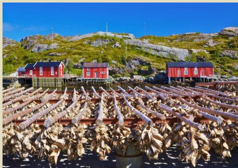
努斯峽灣『羅弗敦保存最好漁村』