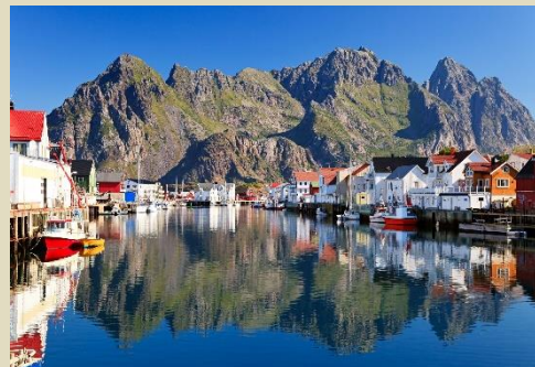
亨寧斯維爾『羅弗敦群島威尼斯』