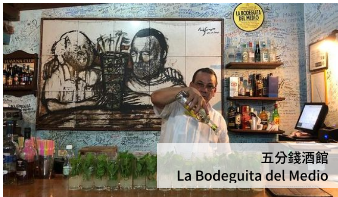
五分錢酒館 La Bodeguita del Medio