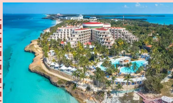
全球十大名灘之一的華倫迪勞，住宿五星級 Meliá Varadero 酒店或同級