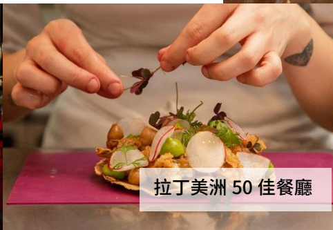
拉丁美洲 50 佳餐廳