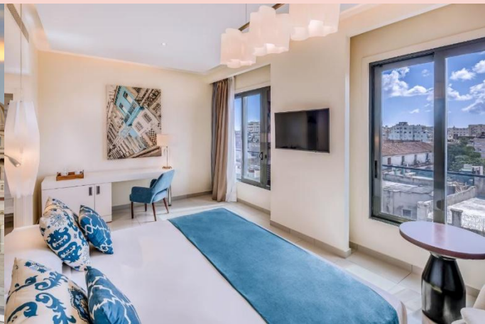
夏灣拿住宿 3 晚五星級 Hotel Meliá Collection Gran Hotel Bristol Habana Vieja 酒店或同級