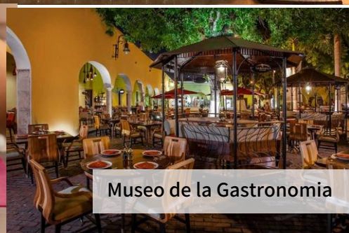
Museo de la Gastronomía