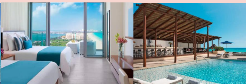
入住 2 晚坎昆豪華酒店 5 星級 Secrets The Vine Cancun(全包式) 酒店或同級，盡享醉人加勒比海風情

七間主題餐廳提供美食及飲品(不含酒精)讓您盡情享用。體驗眾多日間活動、主題派對和夜間現場娛樂活動，打造精彩難忘的瞬間。