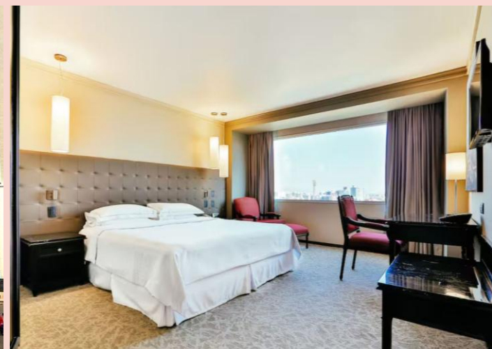
墨西哥城入住 4 晚入住五星級 Barcelo Mexico Reforma 酒店或同級