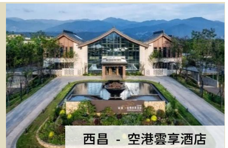
西昌 - 空港雲享酒店

“成都金融商圈 國際品牌 5 星酒店” 金融城英迪格酒店(Indigo) - 2025 年開業