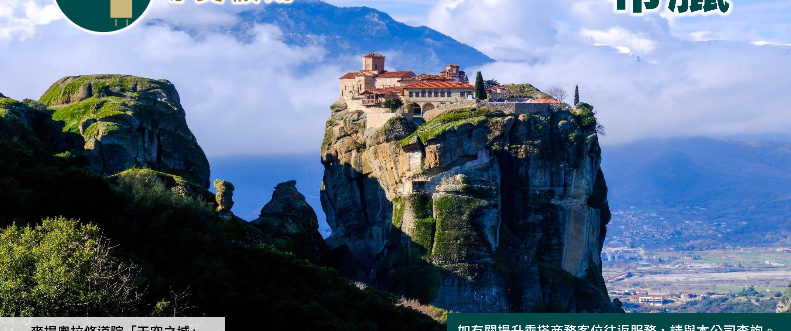
麥提奧拉修道院「天空之城」