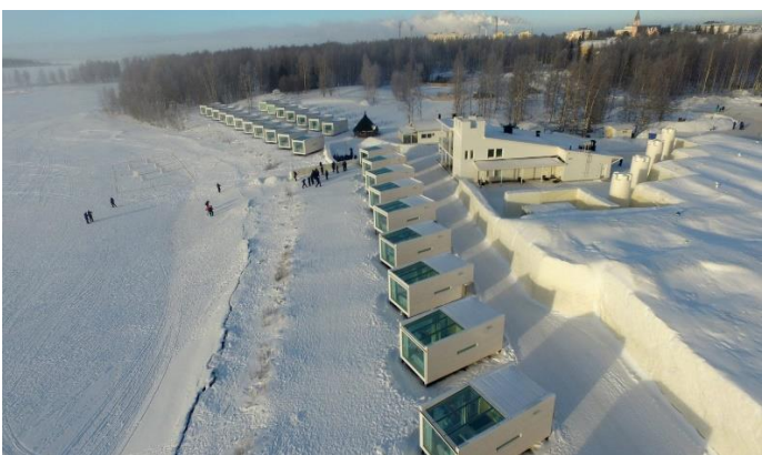
↔: Seaside Glass Villas 玻璃屋酒店或同級 (玻璃屋類型繁多，圖片只供參考)