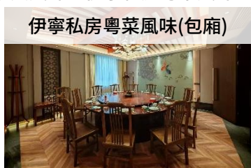
伊寧私房粵菜風味(包廂)