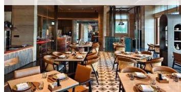
庫爾勒萬麗酒店特色風味