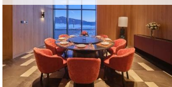
禾木希爾頓酒店特色風味