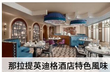
那拉提英迪格酒店特色風味