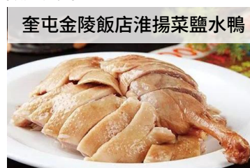
奎屯金陵飯店淮揚菜鹽水鴨