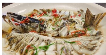
布爾津額河冷水魚

7 晚酒店晚餐： 烏魯木齊希爾頓酒店自助餐、禾木希爾頓酒店特色風味、喀納斯賈登峪酒店特色風味、布爾津白樺林野奢營地酒店疆粵風味、奎屯金陵國際飯店淮揚菜、那拉提英迪格酒店特色風味、庫爾勒萬麗酒店特色風味 當地特色風味： 阿勒泰額河冷水魚風味、伊寧私房粵菜風味、庫車烤全羊風味、烏魯木齊特色歡送風味