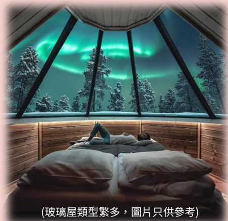
(玻璃屋類型繁多，圖片只供參考)