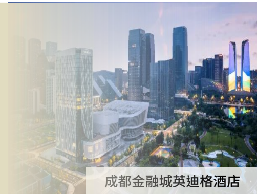
成都金融城英迪格酒店