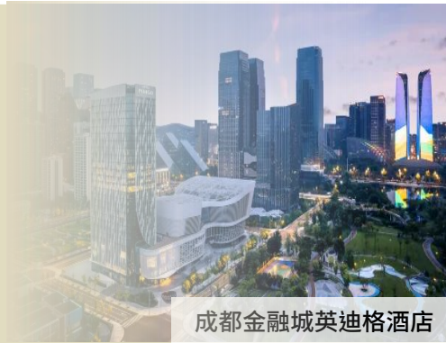
成都金融城英迪格酒店