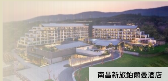
南昌新旅鉅爾曼酒店