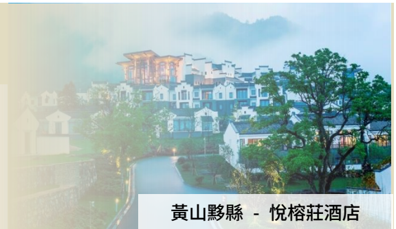
黃山黟縣 - 悅榕莊酒店

“2024 年開幕全新國際品牌 5 星酒店” 黃山屯溪橫江灣凱悅酒店【江景客房】