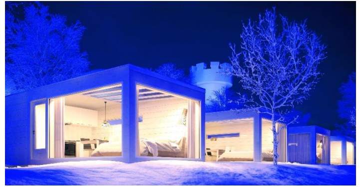
↔: Seaside Villa 玻璃屋或同級 (玻璃屋類型繁多，圖片只供參考)