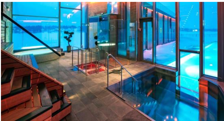
↔: Cape East - Hotel & SPA 酒店或同級 註：進入 Cape East Hotel SPA 必須年滿 7 歲。