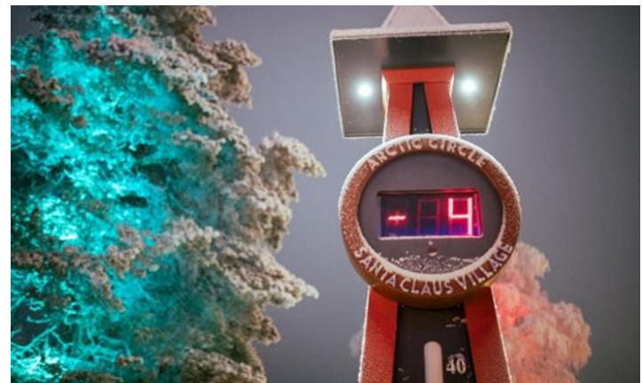
↔: Scandic Rovaniemi City 酒店或同級

❄️聖誕老人村：與聖誕老人會面，並可於專屬的郵局寄出蓋上獨一無二聖誕老人郵戳的明信片。團友可在北極圈的交界線拍照留念，並獲贈證明書一張。