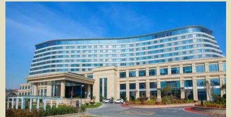
烏魯木齊-希爾頓酒店