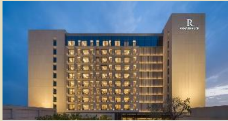
庫爾勒綠發萬麗酒店(2025 年開業)