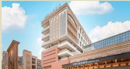
喀什古城逸扉酒店(2025 年開業)