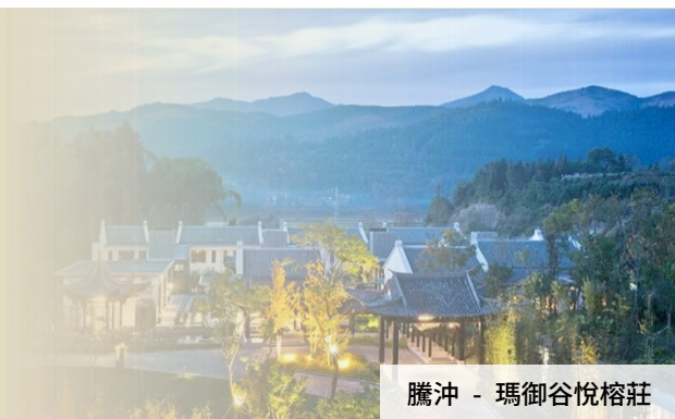
騰沖 - 瑪御谷悅榕莊