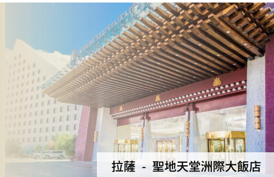
拉薩 - 聖地天堂洲際大飯店