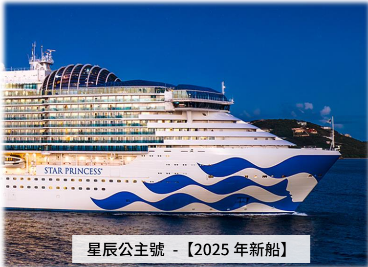
星辰公主號 - 【2025年新船】