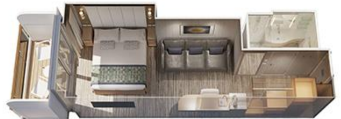
露台房面積約 179 ~ 279 平方尺