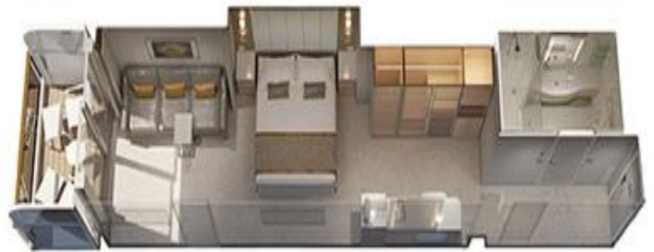
迷你套房面積約 304 平方尺