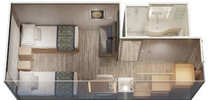
內艙房面積約 160 ~ 185 平方尺