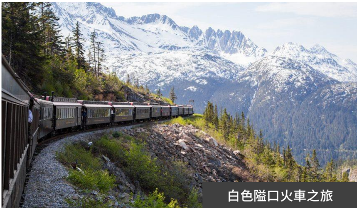
白色隘口火車之旅