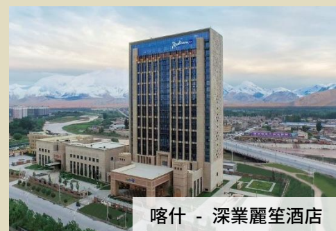
喀什 - 深業麗笙酒店