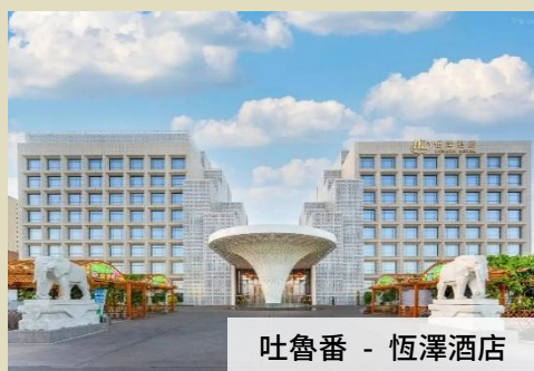
吐魯番 - 恆澤酒店