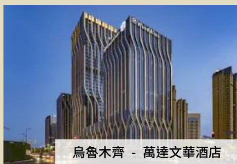
烏魯木齊 - 萬達文華酒店