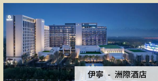
伊寧 - 洲際酒店