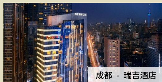
成都 - 瑞吉酒店