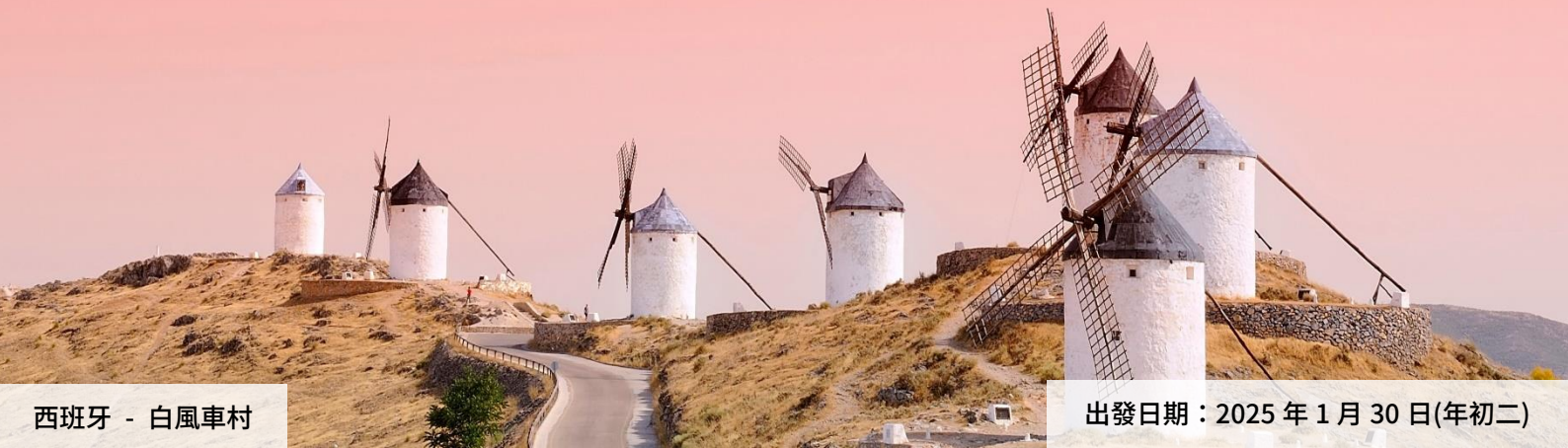
西班牙 - 白風車村