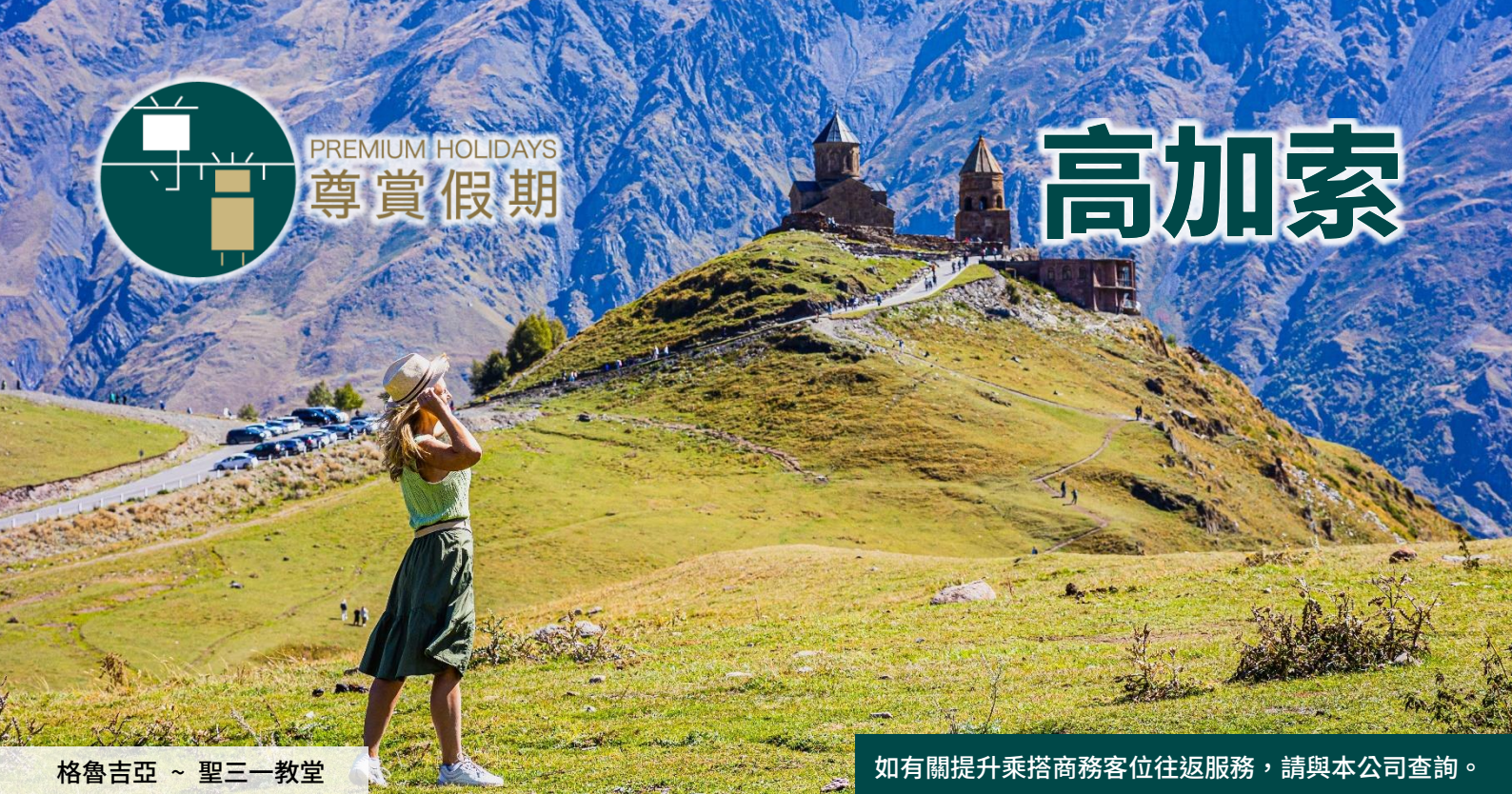
格魯吉亞 ~ 聖三一教堂