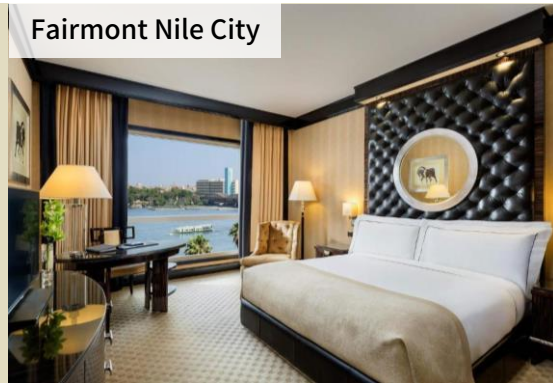
Fairmont Nile City