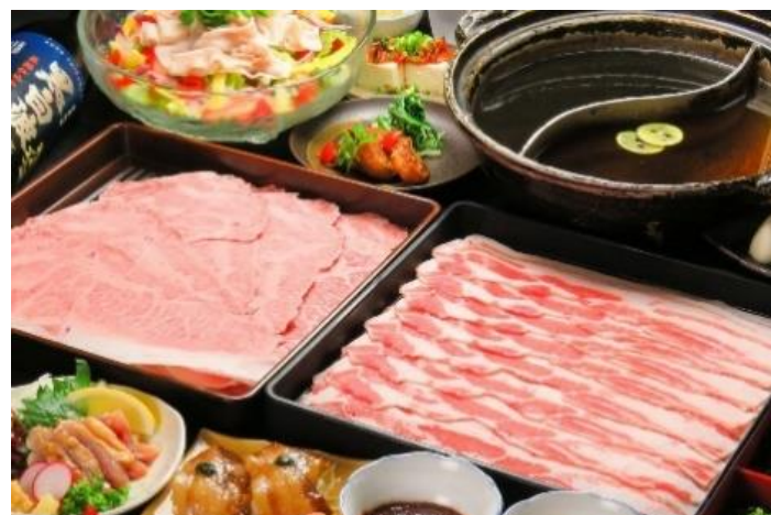
薩摩黑豚 A5 黑毛和牛 Shabu Shabu