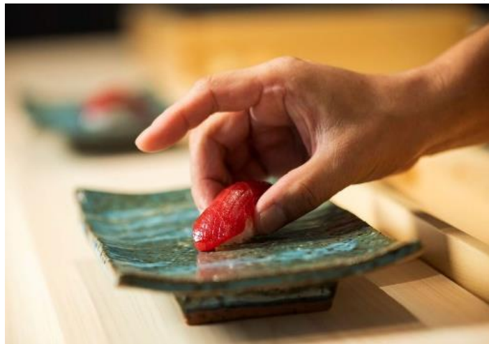
米芝蓮一星 壽司會席料理