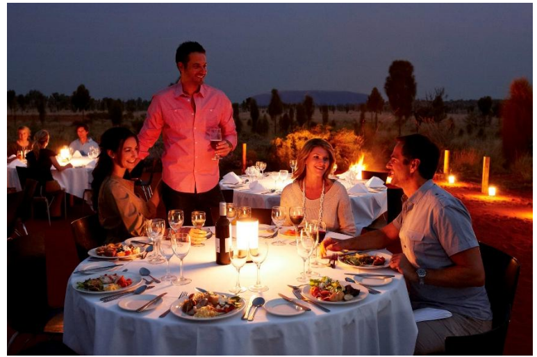
「寂靜之聲」晚宴：在烏魯魯沙漠中，享用星光晚宴，沉浸於寂靜與壯麗的夜空下，感受獨特氛圍。