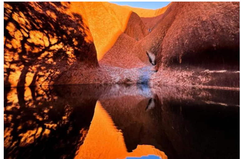
烏魯魯巨岩底、聖跡徒步之旅及文化體驗：深度參觀烏魯魯底部如慕提朱魯水潭及原住民岩畫洞穴等。