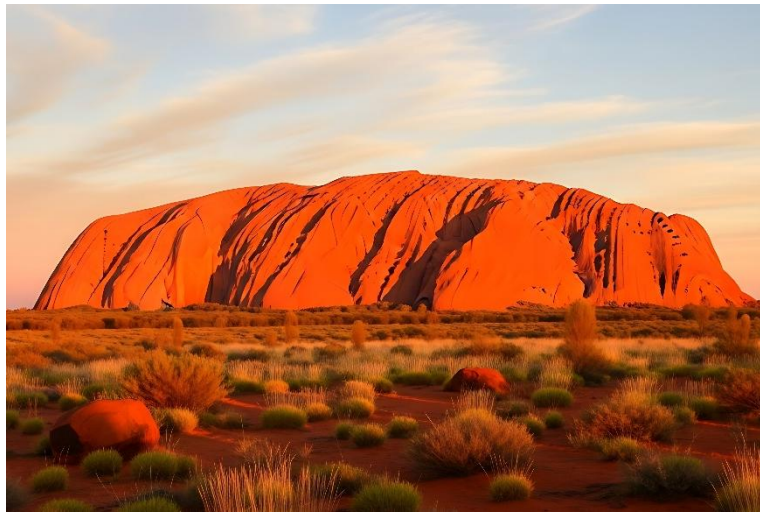
觀賞烏魯魯日出日落：巨岩在晨昏光影中變幻萬千色彩，感受紅土中心絕美壯麗。

住宿烏魯魯期間，可體驗壯麗日出和日落、原住民文化導覽、環繞巨岩徒步之旅、享受沙漠星空、乘坐直升機觀光等，活動豐富多元化，讓您深入感受這片神聖之地的魅力。