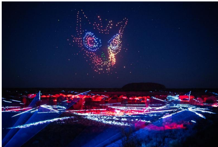
烏魯魯暮光傳說無人機表演：沉醉於烏魯魯的日落，於沙漠上空欣賞令人眼花繚亂的無人機和激光表演。