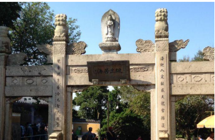
📍 5 星標準 普陀山祿緣閣精品酒店或同級