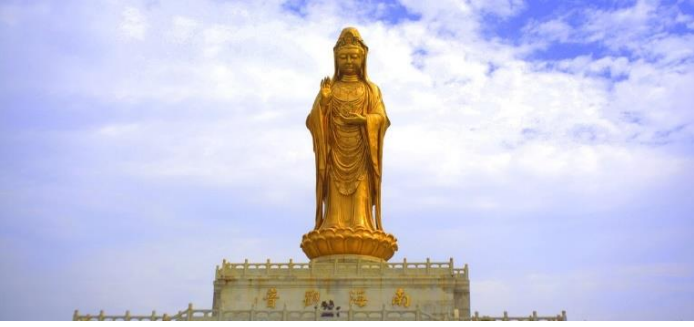
📍 紫竹林(不肯去觀音院) : 不肯去觀音院位於紫竹林內，潮音洞旁，這裡是普陀山建寺最早的地方。因山中岩石呈紫紅色，剖視可見柏樹葉、竹葉狀花紋、因稱紫竹石，後人在此栽有紫竹而得名。