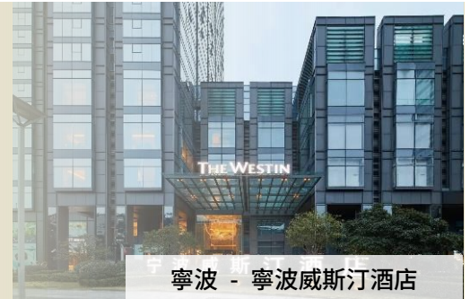
寧波 - 寧波威斯汀酒店