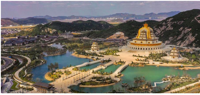
📍 南海觀音 : 33 米高南海觀音即普陀山南海觀世音立像，坐落於佛教 聖地觀音菩薩道場普陀山東端的雙峰山之上，規模宏大，是普陀山的地標性建築，遠遠望去便可以看到。