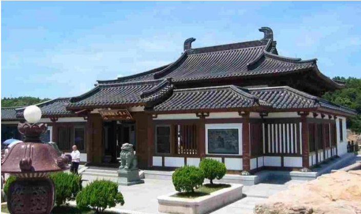
📍 珞珈山(包乘船往返) : 位於普陀山東南約 5 公里處，與之隔海相望。法華經載，於此地方有山，彼有菩薩，名觀自在。歷史上都把普陀珞珈連在一起，相傳為觀音菩薩發跡、修行之地。