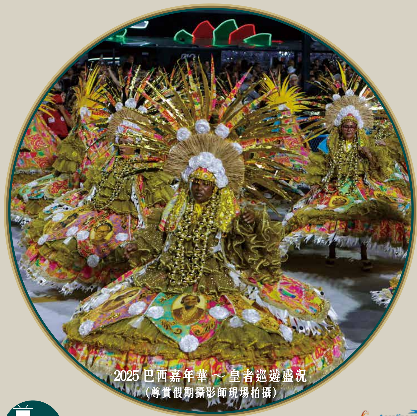
2025 巴西嘉年華～皇者巡遊盛況