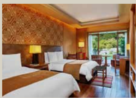
烏魯班巴河谷入住 5星級Tambo Del Inka, a Luxury Collection Resort & Spa烏魯班巴唯一 擁有火車站前往馬丘比丘