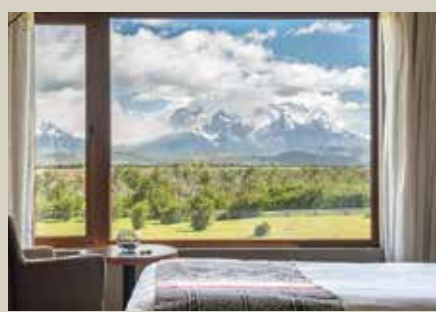
百內國家公園入住特色渡假酒店 Rio Serrano 或 Lago Grey