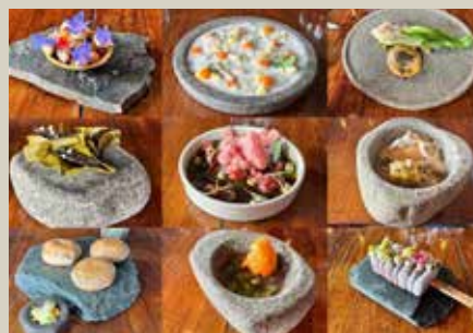
南美洲 50 佳餐廳 Gustu