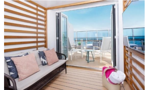
小屋迷你套房面積約 329 平方尺