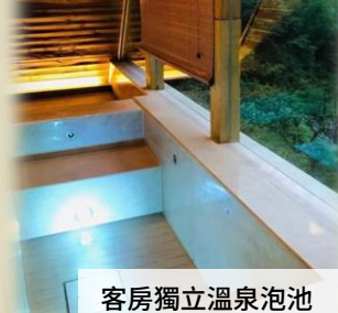
客房獨立溫泉泡池