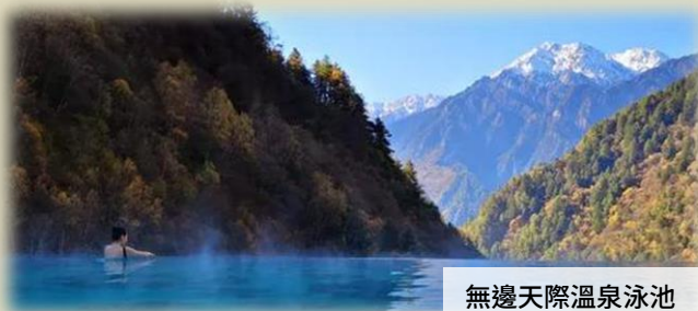
無邊天際溫泉泳池