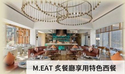
M.EAT 炙餐廳享用特色西餐