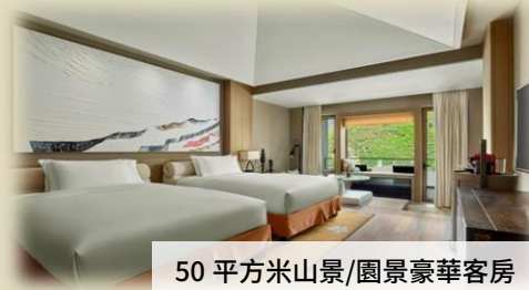
50 平方米山景/園景豪華客房