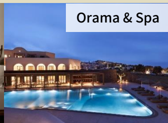
Orama & Spa