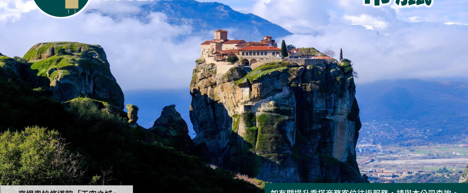
麥提奧拉修道院「天空之城」