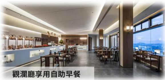
觀瀾廳享用自助早餐