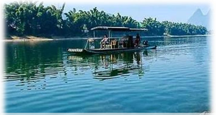
乘悅榕莊專屬竹筏遊灘江