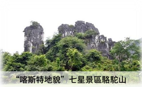
“喀斯特地貌” 七星景區駱駝山