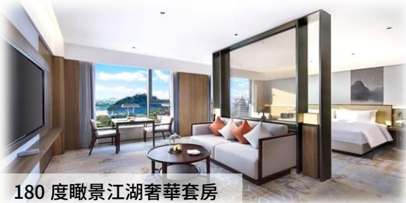
180 度瞰景江湖奢華套房