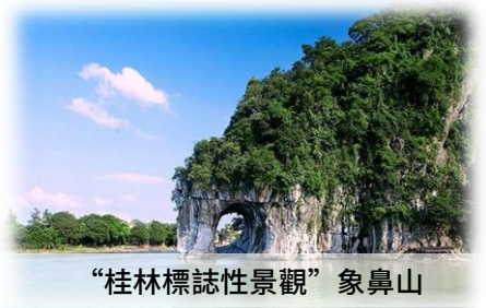
“桂林標誌性景觀” 象鼻山