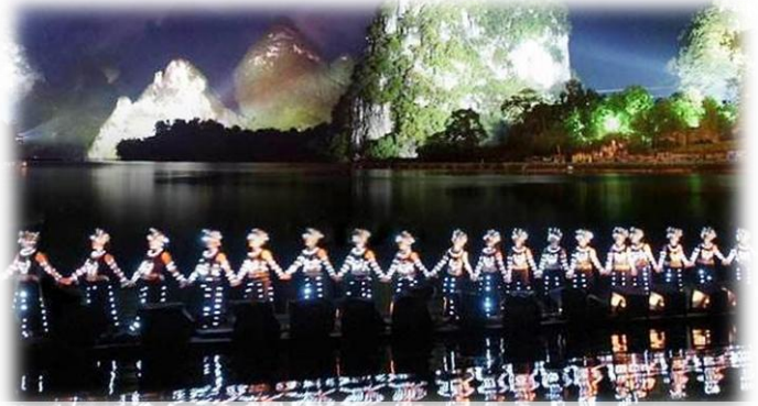
“全中國首部山水實景歌舞表演”《印象劉三姐》，安排貴賓