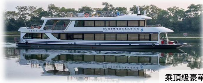
乘頂級豪華遊船漫遊灕江