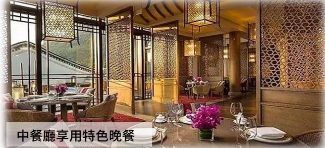
中餐廳享用特色晚餐