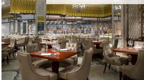
西寧住宿酒店自助晚餐

敦煌：飛天歌舞迎賓宴、大漠風沙雞風味、住宿酒店風味晚餐 大柴旦：西北菜風味 烏素特：住宿酒店風味晚餐 茶卡：炕鍋羊排風味 西寧：住宿酒店自助晚餐 張掖：裕固族風味