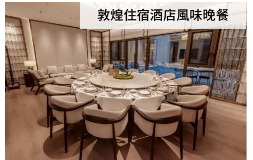
敦煌住宿酒店風味晚餐