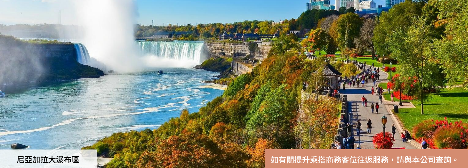
尼亞加拉大瀑布區