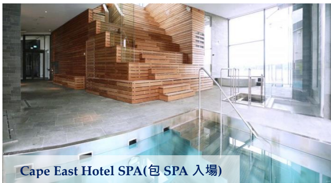
Cape East Hotel SPA(包 SPA 入場)

※如極地探險號破冰船因客滿或船期取消，將改為乘坐 Sampo 破冰船。 ※如遇天氣或氣候影響，引致破冰船不能啟航，已報名團友可獲退回港幣 $1,500，團友不可因此退出。冰海飄浮之樂參加者高度需至少 140cm。