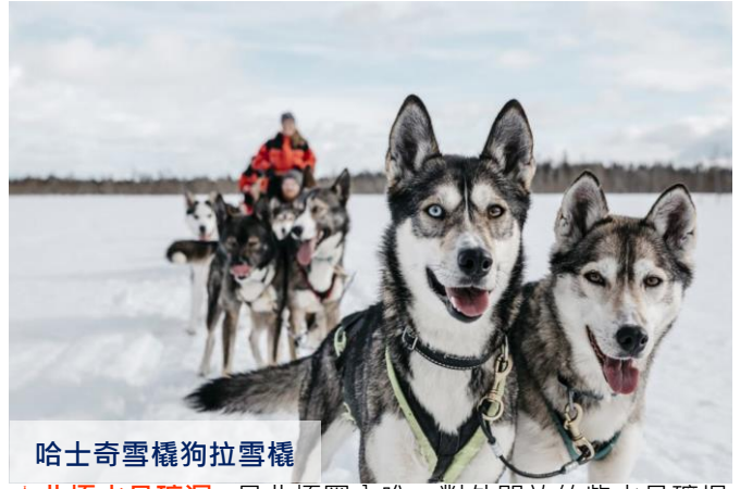
哈士奇雪橇狗拉雪橇

北極水晶礦洞： 是北極圈內唯一對外開放的紫水晶礦場。特別安排搭乘雪地拖車(Pendolino) 前往參觀，一邊聆聽拉普蘭土著流傳的古老紫水晶傳說，一邊欣賞埋在地下 20 億年的水晶石世界。更可嘗試親手挖掘屬於自己的幸運紫水晶，機會難得！