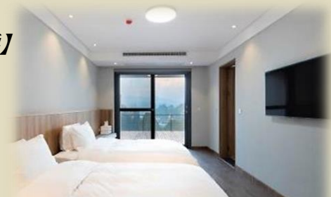
雅致觀日軒客房-66 平方米 (約 708 尺)