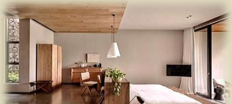
麗世套房-100 平方米 (約 1074 尺)

坐落於中國及越南的邊境，依偎於明仕河畔，如畫般的熱帶景色呈現在這個精品度假村中。現代主義建築的精髓加之與大自然的融合，半隱於喀斯特地貌的山石中，享受著河畔慢生活之邊境逸世體驗。