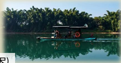
山脈/田園印象套房-66 平方米 (約 708 尺)