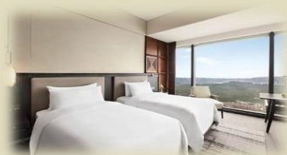
臻選豪華房-45 平方米 (約 483 尺)