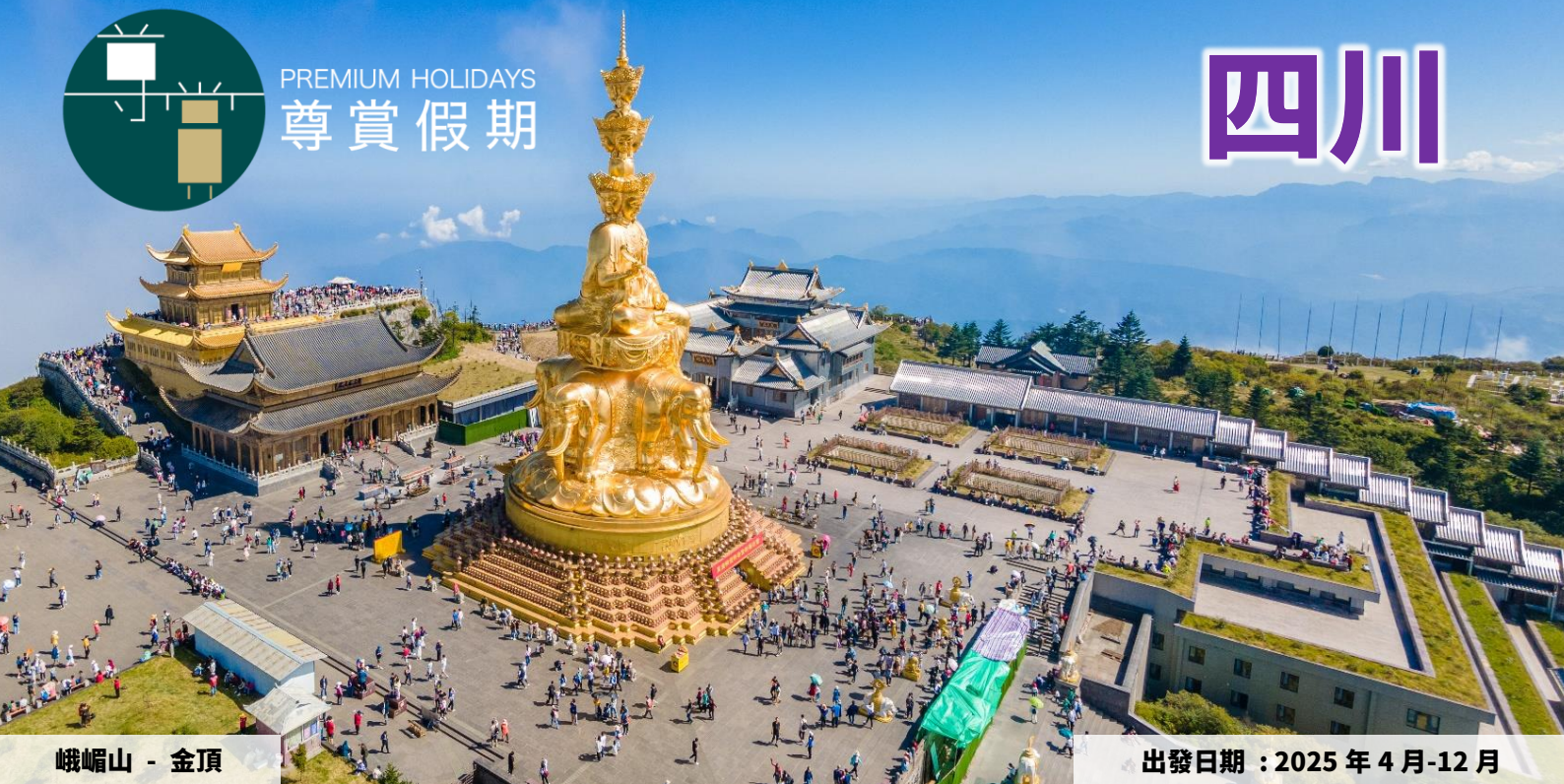
峨嵋山 - 金頂