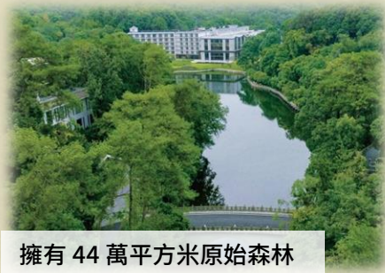
擁有 44 萬平方米原始森林

酒店坐落於世界自然與文化遺產的峨眉山腳下，與著名的報國寺相鄰。這裡的環境優美，圍繞廣闊的原始森林和天然湖泊。擁有 2000 多萬年礦化齡的森林溫泉，享受自然美景的同時也能放鬆身心。