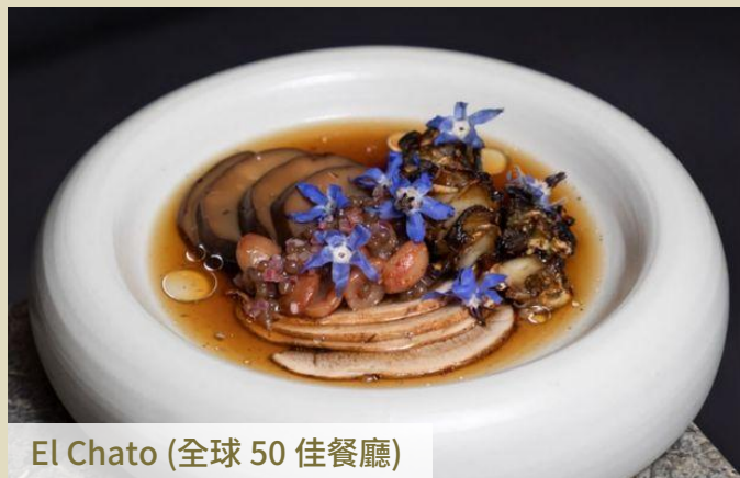
El Chato (全球 50 佳餐廳)

哥倫比亞: El Chato (全球 50 佳餐廳)、 Celele(拉丁美洲 50 佳餐廳)、著名餐廳 El Carmen、 Andrés Carne de Res、Juan Deld Mar 古巴: Mural de la Prehistoria、西式龍蝦、 著名餐廳 La-Floridita (海明威最喜歡的餐廳)、 著名酒吧 La Bodeguita del Medio 品味 Mojito 雞尾酒 墨西哥: 著名餐廳 Lorea、Villa Maria、著名餐廳 Mugy、 Xcaret 生態公園欣賞民俗歌舞表演連晚餐