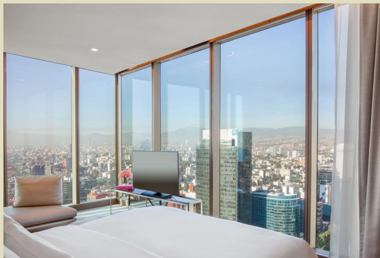
墨西哥城入住 3 晚 5 星級 Sofitel Mexico City 酒店或同級

七間主題餐廳提供美食及飲品(不含酒精)讓您盡情享用。體驗眾多日間活動、主題派對和夜間現場娛樂活動，打造精彩難忘的瞬間。