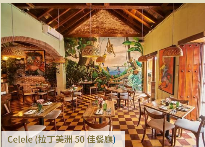
Celele (拉丁美洲 50 佳餐廳)