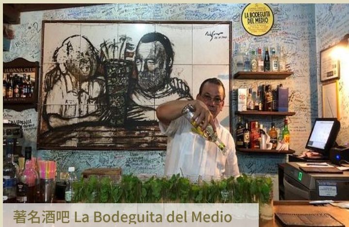
著名酒吧 La Bodeguita del Medio