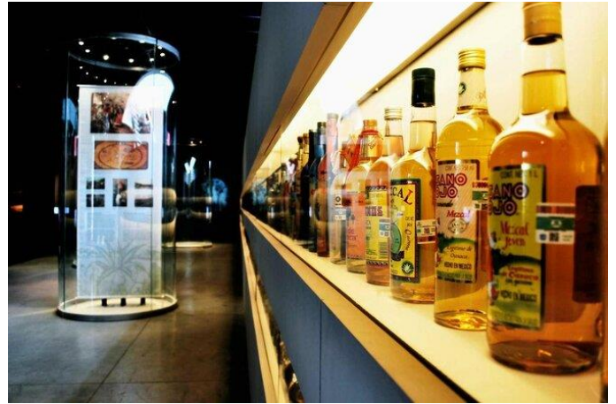
📍：5 星級 Sofitel Mexico City 酒店或同級

📍龍舌蘭酒博物館：墨西哥的原住民族早在西班牙入侵殖民前，就已經開始製作龍舌蘭酒。瞭解龍舌蘭酒和梅斯卡爾酒的釀造過程，觀看博物館周圍 2000 多個不同的展示酒瓶。