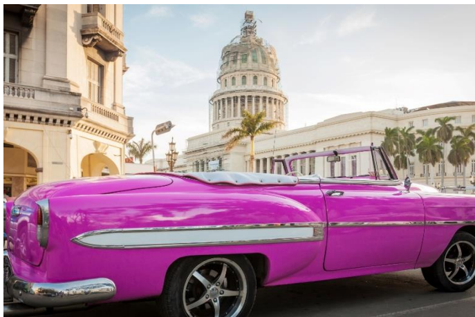
📍：5 星級 Sofitel Mexico City 酒店或同級

📍古董車暢遊：體驗乘搭特色古董車暢遊夏灣拿新城區及舊城區著名景點：包括革命廣場、國會大廈、何塞馬蒂紀念塔、海濱大道。