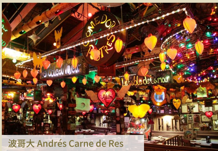
波哥大 Andrés Carne de Res