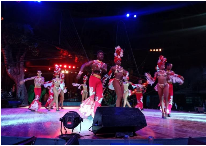
📍：5 星級 Manzanera Kempinski 酒店或同級