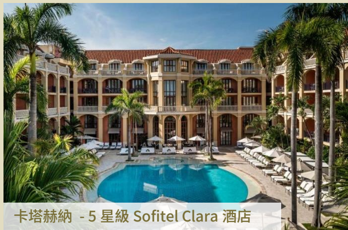
卡塔赫納 - 5 星級 Sofitel Clara 酒店