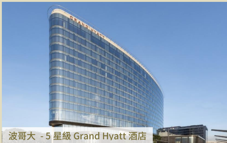
波哥大 - 5 星級 Grand Hyatt 酒店

夏灣拿住宿 2 晚五星級 Manzana Kempinsky 酒店，地處老城區，優越位置。