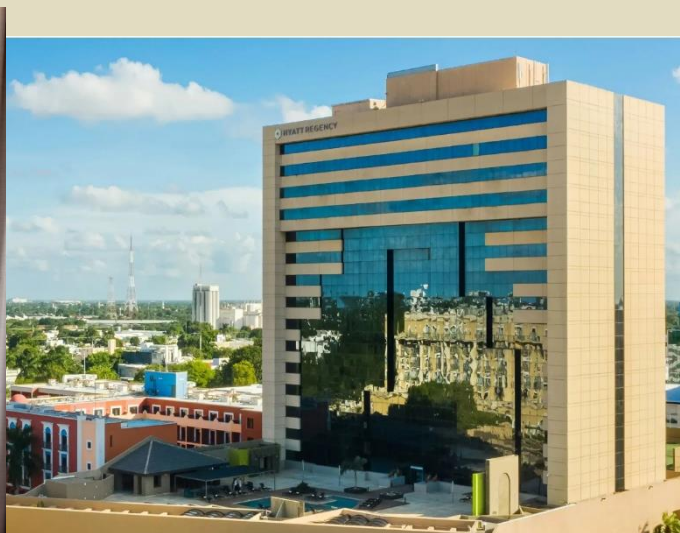
梅里達入住 5 星級 Hyatt Regency 酒店或同級