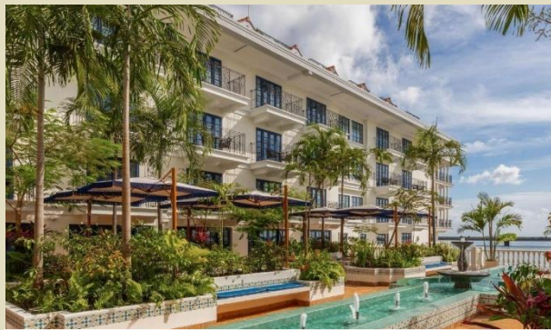
巴拿馬 - Sofitel Legend Casco Viejo 酒店