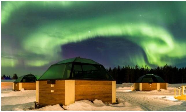
📍: Arctic Snow 玻璃屋酒店或同級(圖片只供參考)