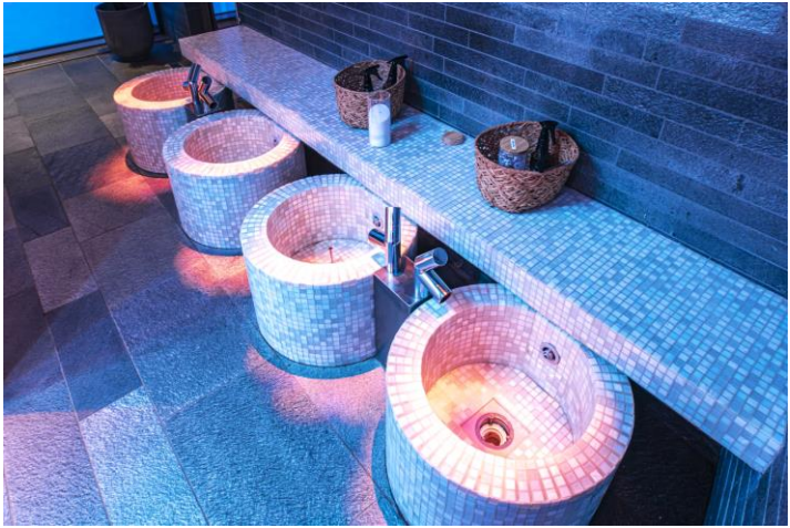
↔: Cape East - Hotel & SPA 酒店或同級 註：進入 Cape East Hotel SPA 必須年滿 7 歲。