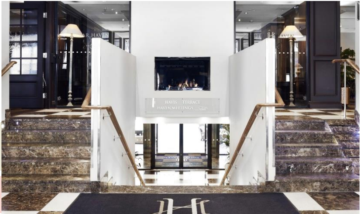
↔: 5 星級 Haven 酒店或同級