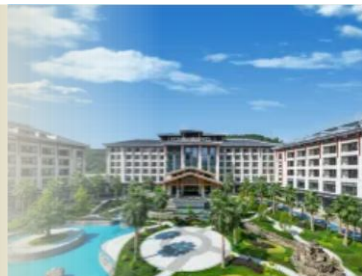
黃果樹福朋喜來登酒店