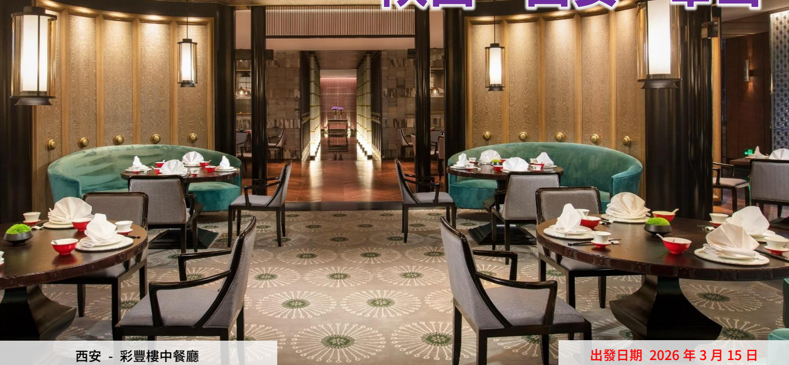
西安 - 彩豐樓中餐廳