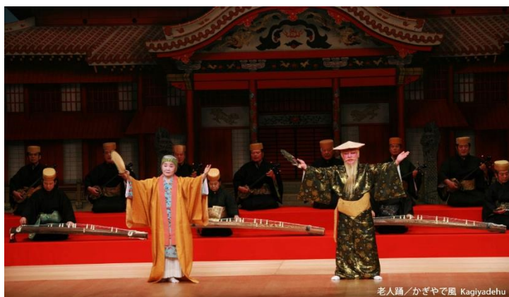
老人踊 / かぎやで風 Kagiyadehu