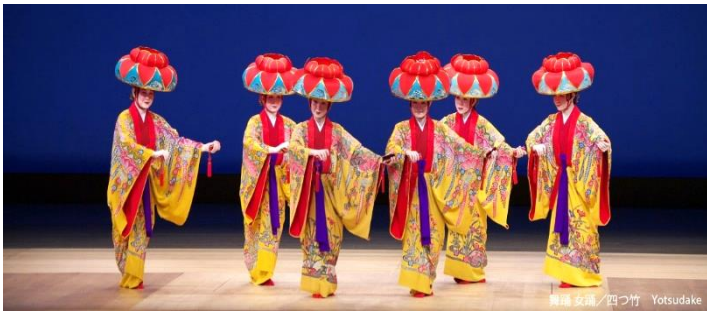
舞臺女唄 / 四つ竹 Yotsudake