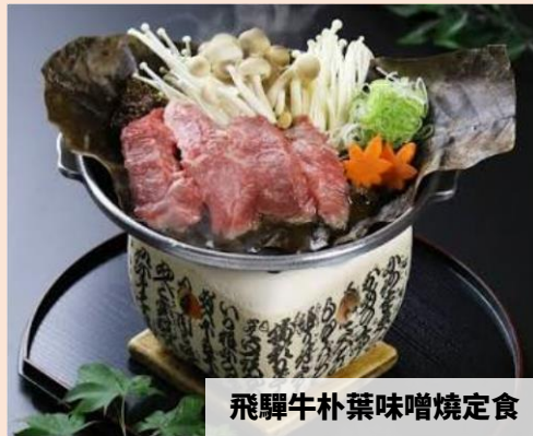
飛驒牛朴葉味噌燒定食