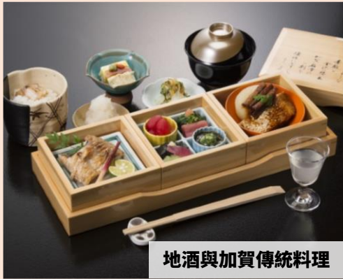
地酒與加賀傳統料理