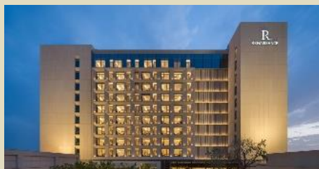
庫爾勒綠發萬麗酒店(2025 年開業)