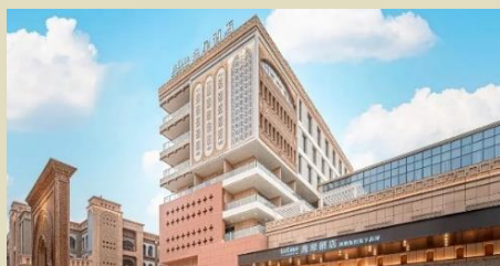
喀什古城逸扉酒店(2025 年開業)