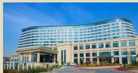
烏魯木齊-希爾頓酒店