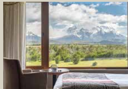
布宜諾斯艾利斯 Hotel Four Seasons或Park Hyatt酒店 或同級