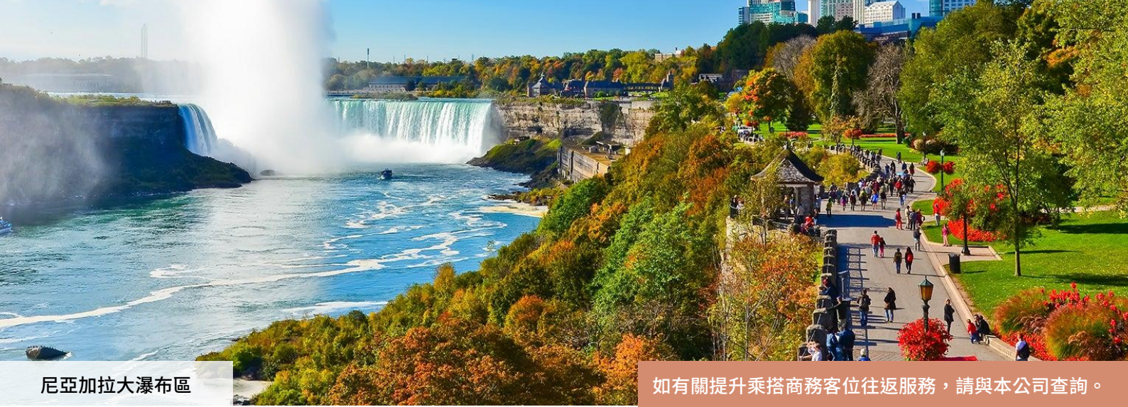
尼亞加拉大瀑布區